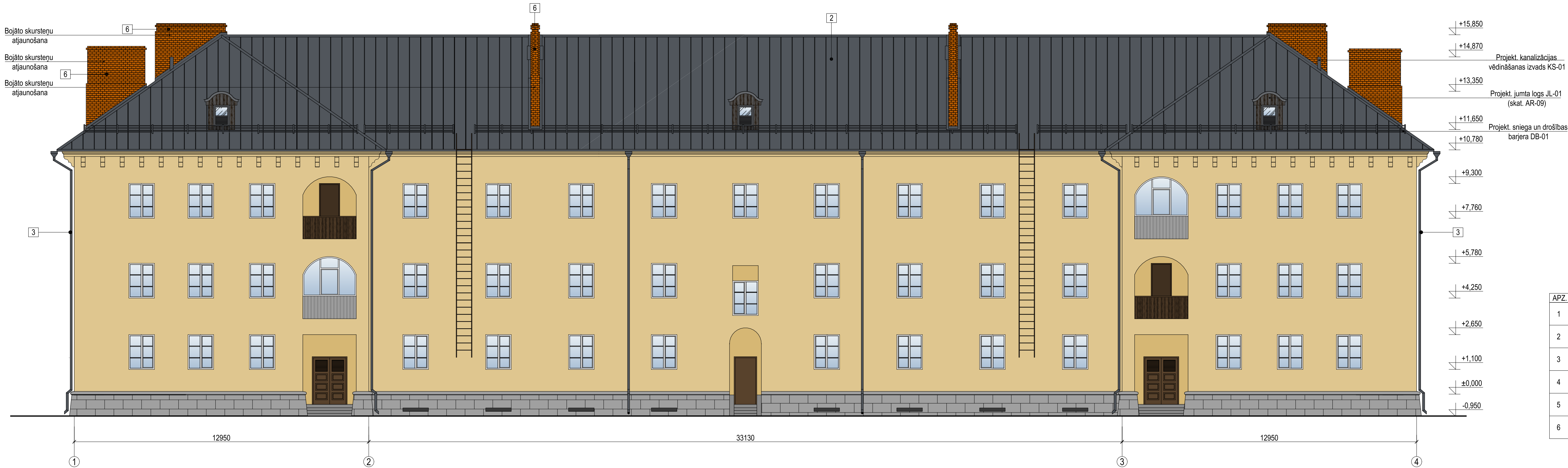
FASĀDE ASĪS 1-4 M 1:100